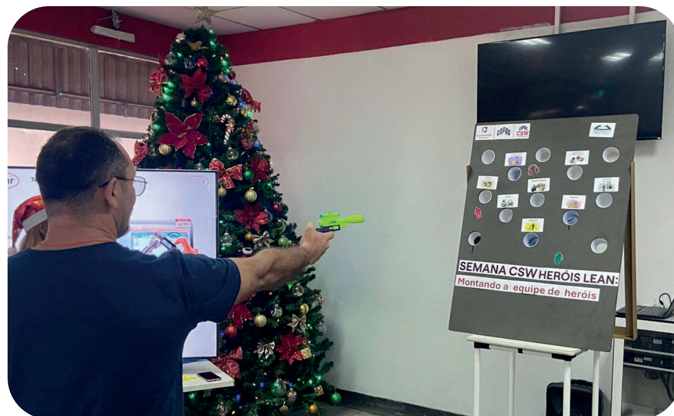
Segunda-feira: Tiro ao Alvo dos Desperdícios