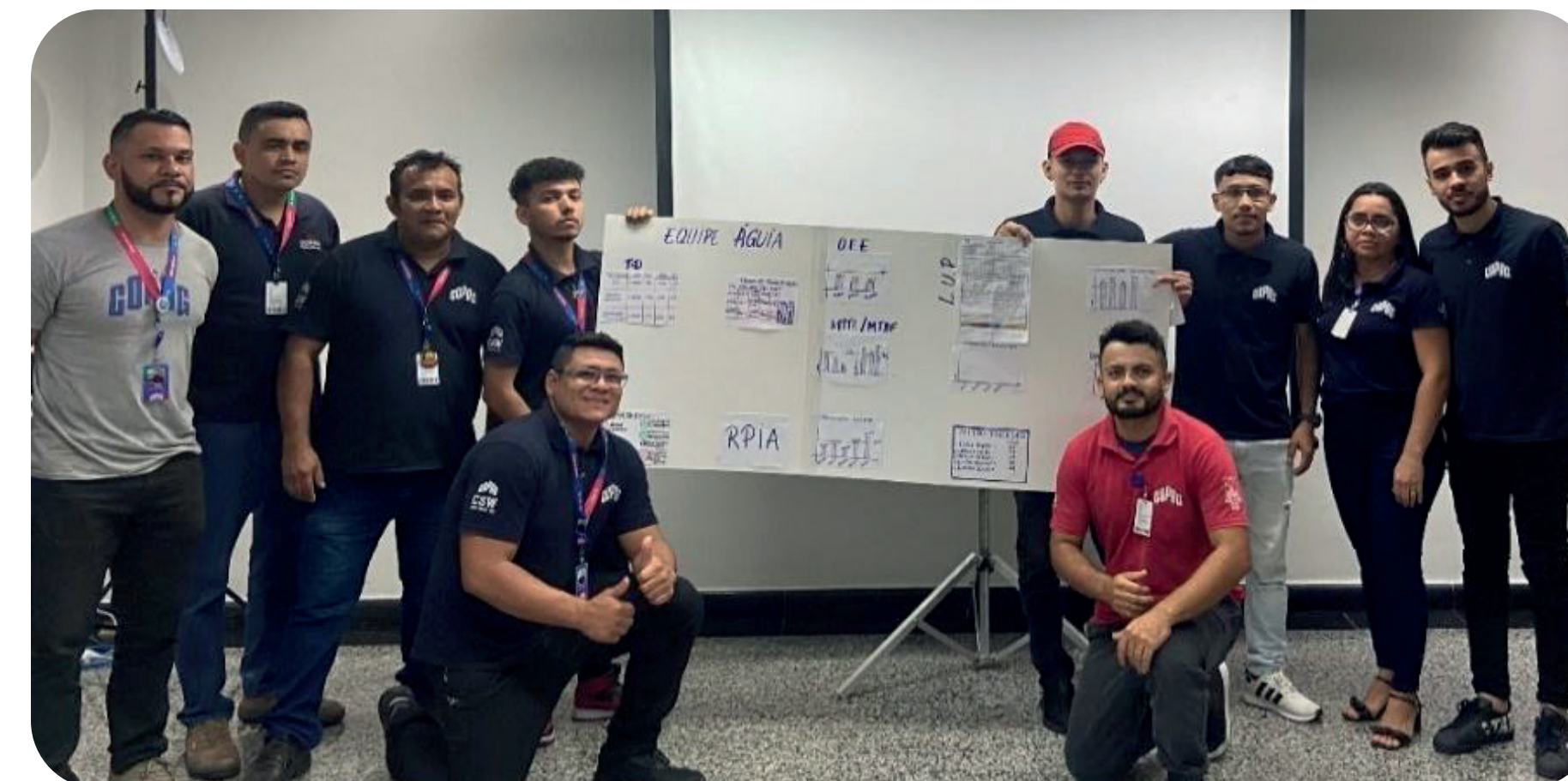
Um dos grupos treinados para expansão do TPM