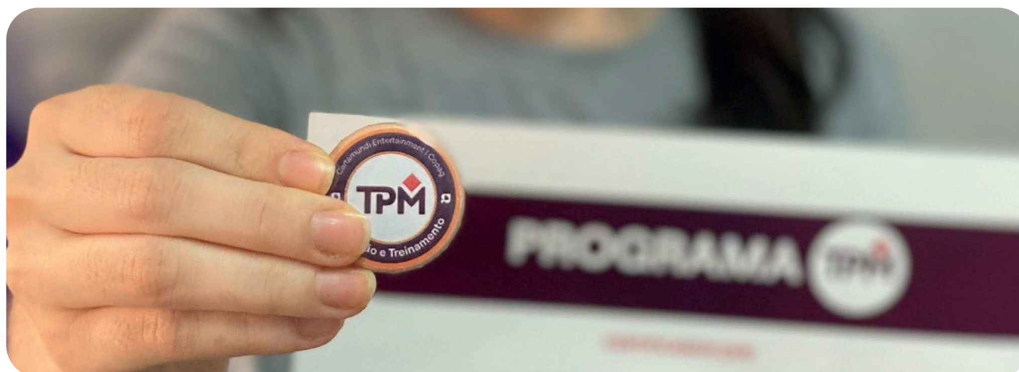
Entrega de certificado e entrega de bottom que representa o pilar que cada colaborador faz parte. Colaboradora: Isadora Pereira

A jornada de 2024 foi uma de transformação, aprendizado e crescimento, com resultados concretos e impactos diretos na eficiência operacional, no engajamento das pessoas e na nossa contribuição para um futuro mais sustentável.