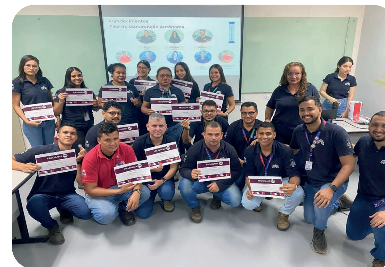
Entrega de certificados e agradecimentos ao pilar de manutenção autônoma