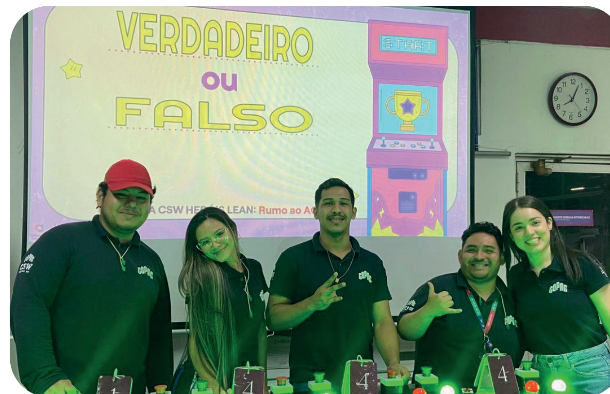
Terça-feira: Verdadeiro ou Falso sobre TPM