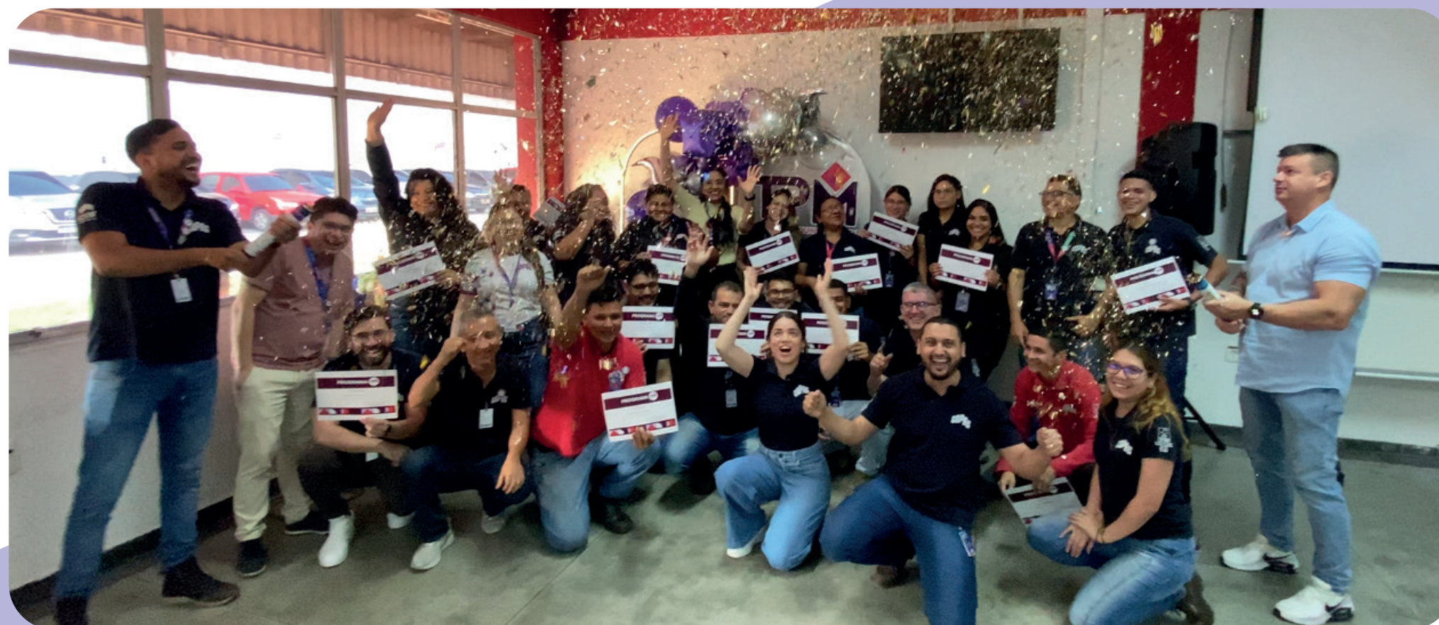
Celebração da evolução do programa