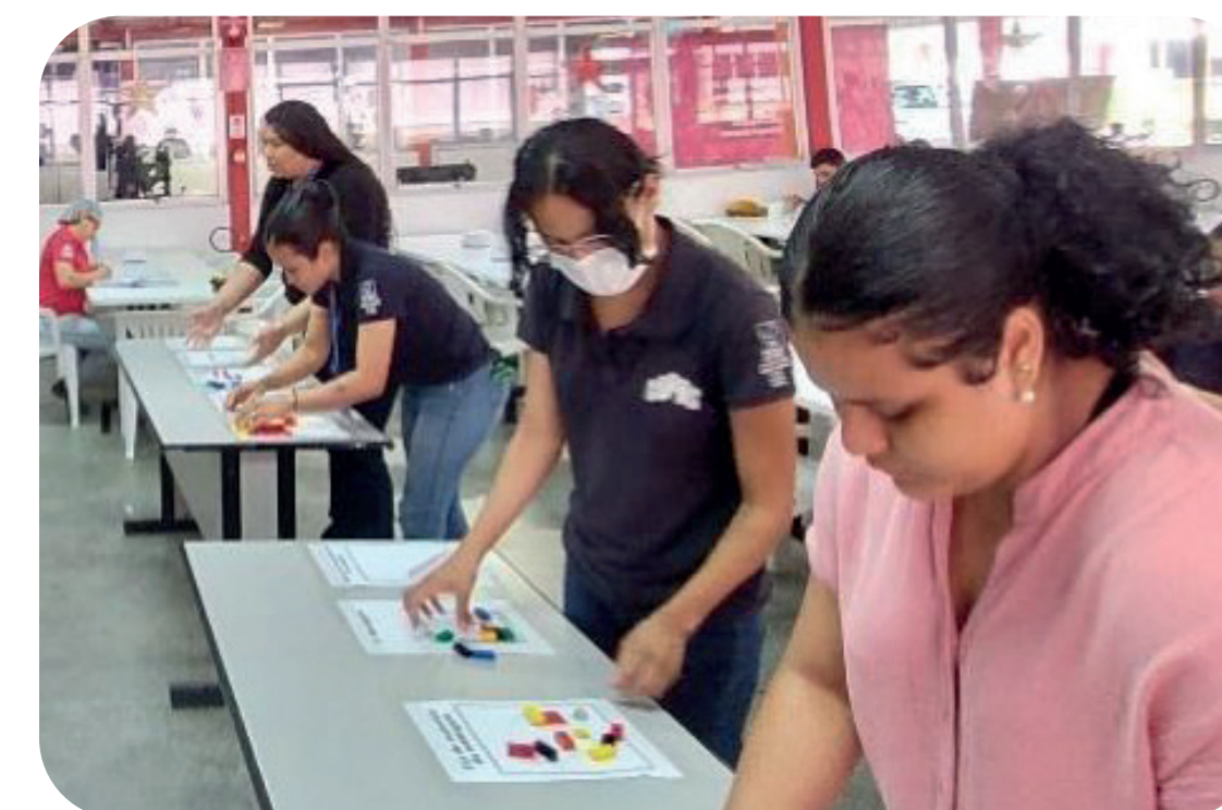
Quinta-feira: Desafio do LEGO