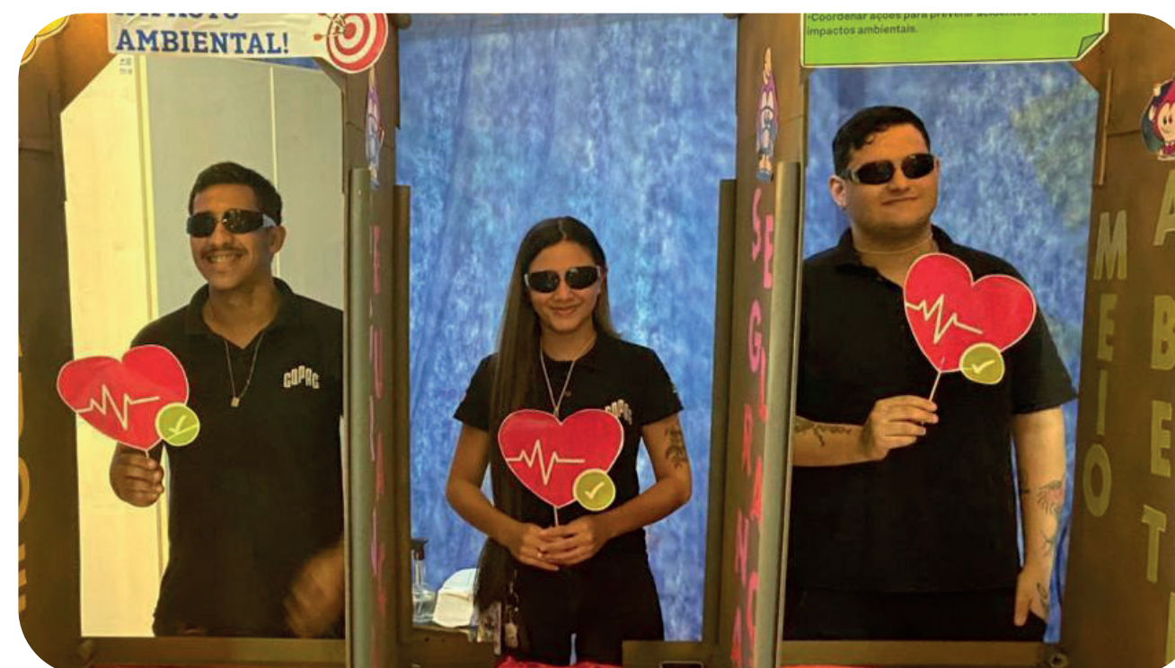
Brincadeira realizada pelo pilar de Saúde, segurança e Meio ambiente.